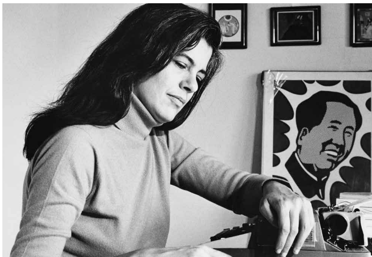
foto: Jim Carlier / Science Source / East News / Oored Bally / AP / East News / IL Patrycja Podkościelny / foto: Blitckwinkel / Alamy / BEEM

98 Przeuszone w tłumaczeniu Agata Klichowska, Krzysztof Marciniak: Niech nasz świat terkocze, huczy, bulgocze i świszczy